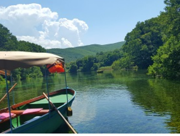
Üsküp - Bitola(Manastır) - Resne - Sv.Naum - Ohrid

Sabah uyandırma, odaların boşaltılması ve kahvaltının ardından Manastır'a doğru yola çıkıyoruz. Manastır'da otobüsümüzden inerek panoramik turumuza başlıyoruz. Günümüzdeki ismi Bitola olan şehirde ilk olarak Mustafa Kemal Atatürk'ün eğitim gördüğü ve bugün şehir müzesi olarak kullanılan Askeri İdadi'yi ziyaret ediyoruz. Atatürk'ün eğitim gördüğü sınıf bugün 'Atatürk Anı Odası' olarak düzenlenmiştir. Ayrıca binada etnografya müzesi de bulunmaktadır. Manastır kent gezimiz sırasında; Türk Çarşısı, Osmanlı döneminden kalma Bedesten, İshak Camii, Yeni Cami gibi eserleri görüyoruz. Manastır kentinin kalbi konumundaki, günlük hayatın aktığı, kafe, restoran ve şık binalarıyla şehrin gözbebeği Şirok Sokak gezimiz sırasında Atatürk'ün hayatından ilginç bir olaya da şahit olacağız. Ohrid'e doğru yola çıkıyoruz. Yolumuz üzerinde bulunan ve elma bahçeleriyle ünlü Resne'de, İttihat ve Terakki'nin en ünlü 3 simasından biri ve Türk-Yunan Savaşı'ndaki faydaları nedeni ile üne kavuşan olan Resneli Niyazi'nin Sarayını bahçesinden görüyoruz. Ardından Sv.Naum'a hareket. Ohrid Gölü'nün kıyısında ve buradan göle ulaşan Kara Drim Nehri'nin kenarına kurulan manastır 16.yy'da inşa edilmiştir. Suyunun temizliğine inanamayacağınız göletteki fotoğraf molamızın ardından Ohrid'e ve otelimize doğru yola çıkıyoruz. Otelimize transfer. Akşam yemeği ve geceleme otelimizde.